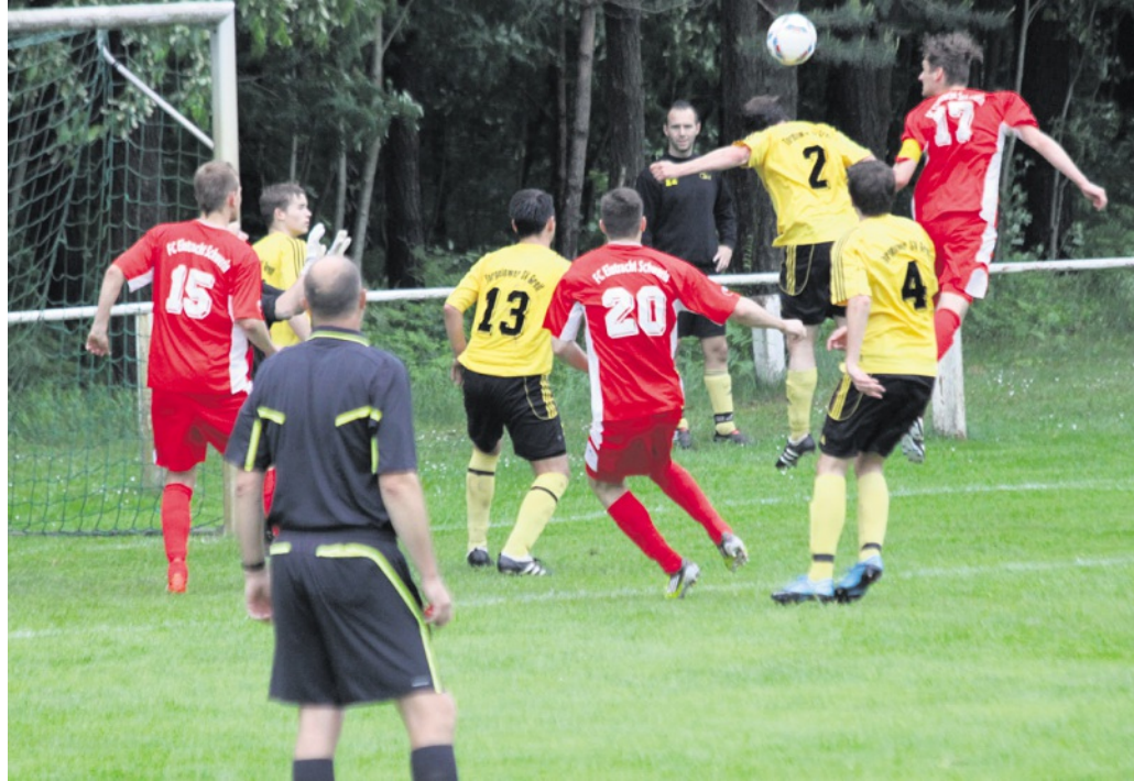
Der FC Eintracht Schwerin hat sich mit einem 5:2-Sieg beim Torgelower SV Greif II noch eine Minichance auf den Klassenerhalt erhalten.