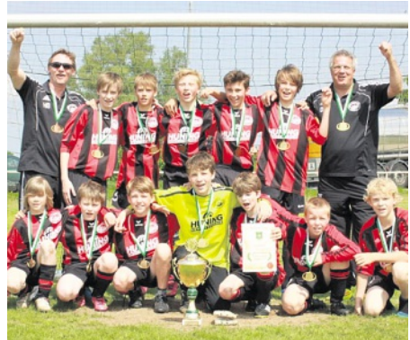
Die D-Junioren der SpVgg Cambs-Leezen sind Kreismeister auf dem Feld und in der Halle.