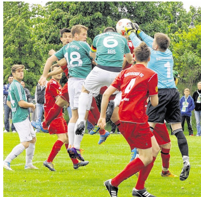
Der MSV Pampow hat sein letztes Heimspiel gegen den Rostocker FC 2:1 gewonnen und spielt nun noch in Schwerin.

FCE Schwerin: Kuhlmann – Deters (46. Zink), Eberst, Looks, Schütze, Möller, Wandt, Michalski, Tillack (46. Richter), Flemming, Hein (72. Schröter)